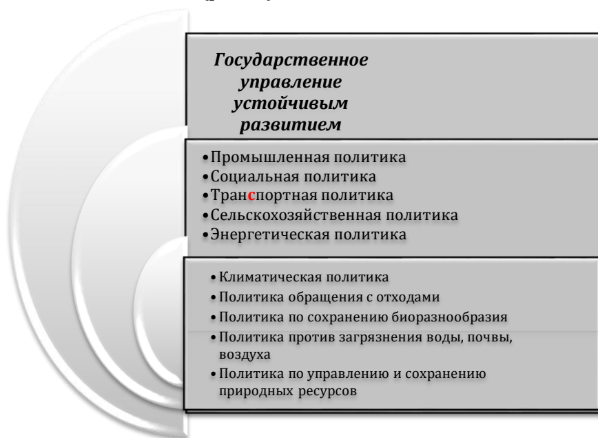
Рисунок 1 – Сфера государственного управления устойчивым развитием

Следует отметить, что область государственного управления устойчивым развитием включает разнообразные направления экологической политики (рис. 1).