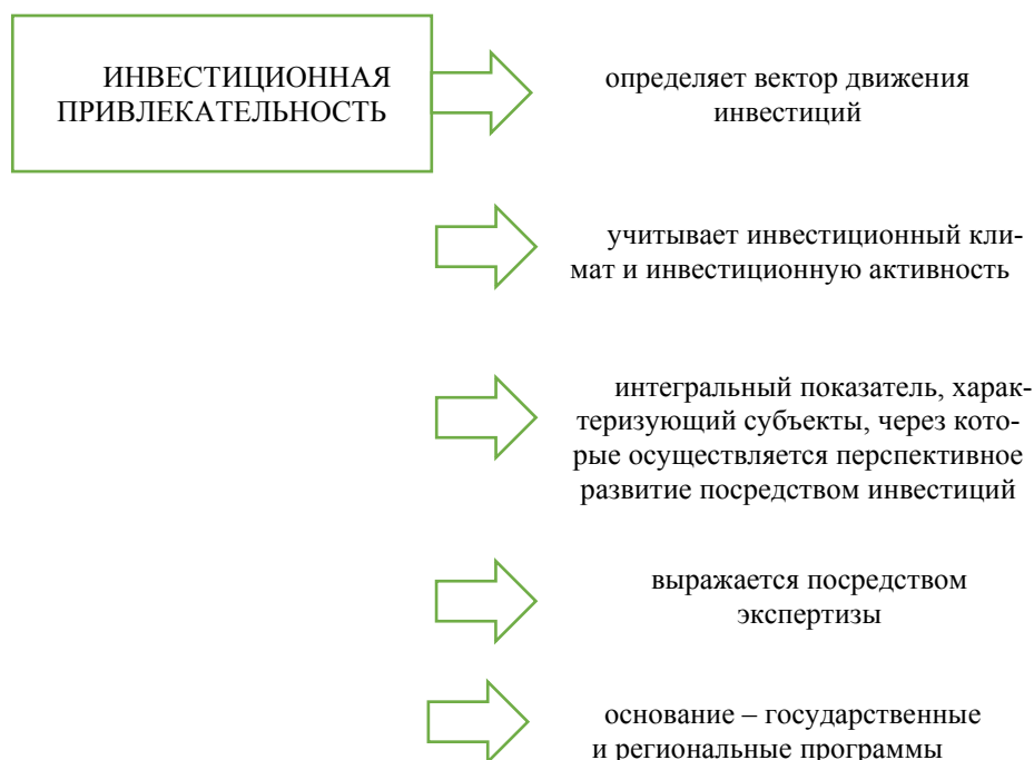
Рисунок 1 – Подходы к инвестиционной привлекательности Figure 1 - Approaches to investment attractiveness

Наибольшее общее представление инвестиционной привлекательности территории позволяет сформировать интегральный индикатор, включающей в себя: (1) потенциал конкурентоспособности территории, (2) потенциал возможности привлечения свободных инвестиционных ресурсов, (3) потенциал, отражающий инвестиционную ёмкость региона. В рамках данных потенциалов достаточно интересным показателем выступает инвестиционная ёмкость региона, которая продуцирует степень восприятия хозяйствующих субъектов к формируемым инвестициям. Выделенный потенциал является достаточно актуальным для сельских территорий. В данном случае создание инвестиционной привлекательности сельских территорий рассматривается с позиции получения эффекта от инвестиций для всех хозяйствующих субъектов. Инвестиционная ёмкость отражает эффект от инвестиций для населения и иных экономических агентов, находящихся на данной территории. Если эффект от инвестиций минимальный, а инвестиционная привлекательность территории явля-