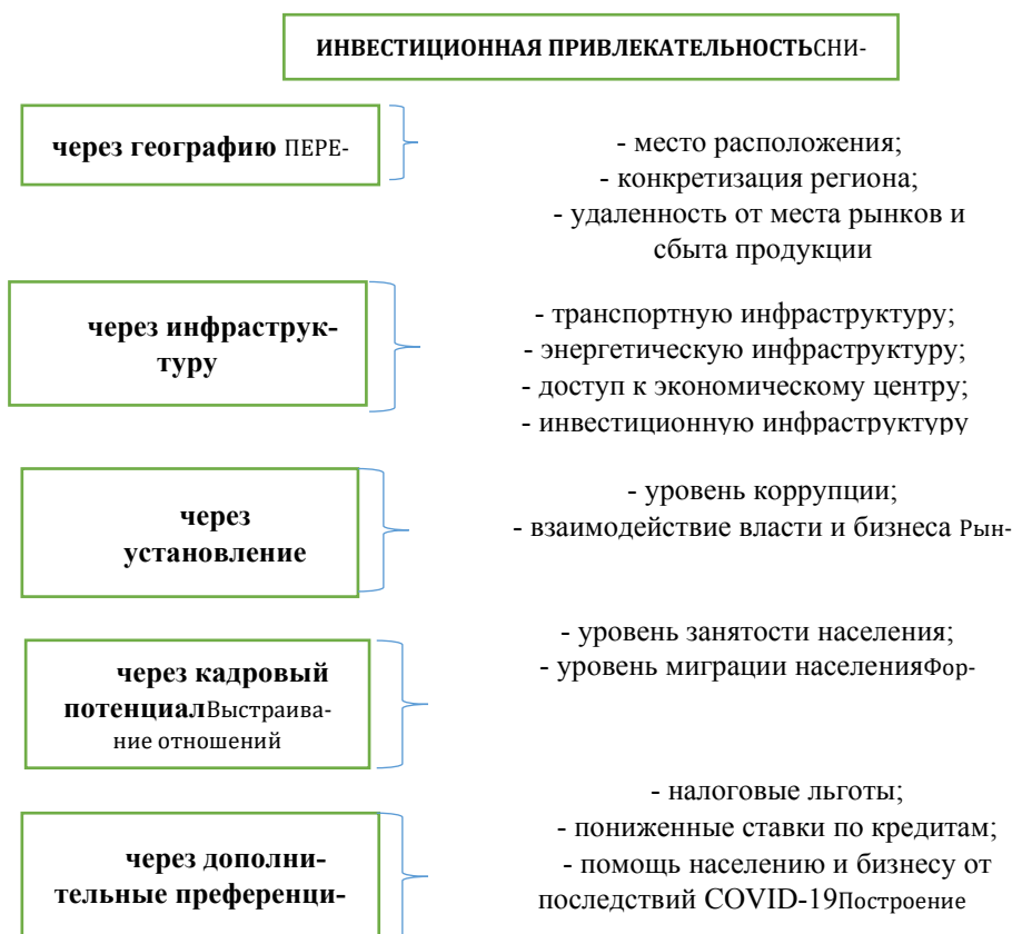
Рисунок 2 – Критерии отбора инвестиционной привлекательности сельских территорий

Изучая вопрос инвестиционной привлекательности сельских территорий, стоит уделить внимание критериям, позволяющим выделить характеристику условий, способствующих привлечению инвестиций (рис. 2).