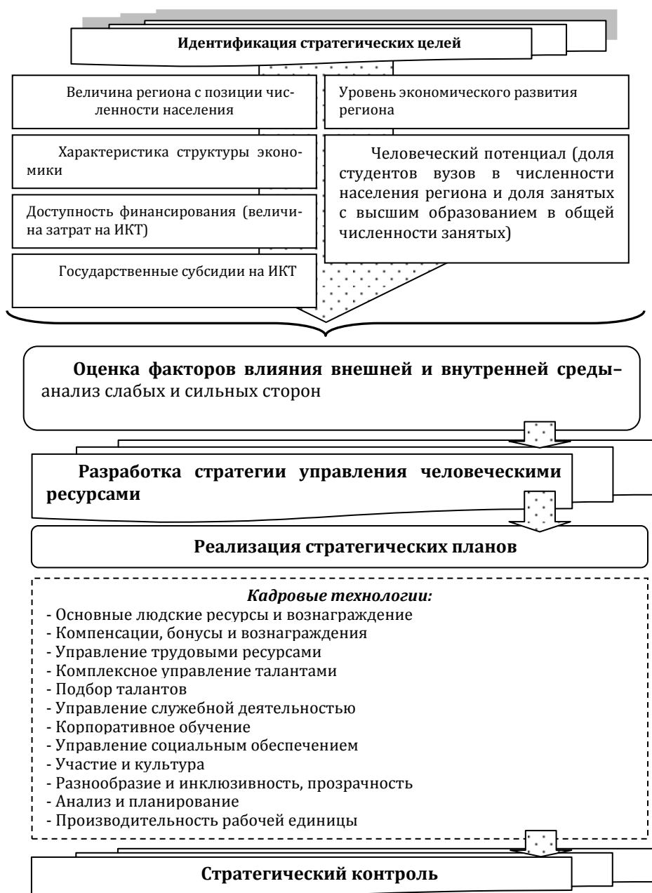
Рисунок 3 – Модель процесса стратегического управления человеческими ресурсами предприятий ИТ-сферы