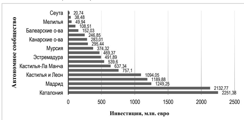
Рисунок 2 – Инвестиции в регионы из национального бюджета в 2019 г. 2 Figure 2 – Investment in regions from the national budget in 2019

Так, Каталония получила от государства больше всего денег, в общей сложности 2 251,38 млн. евро (18,5% от общего объёма). С другой стороны, инвестиции в Сообщество Мадрид увеличились лишь на 0,1% по сравнению с прошлым годом. Андалусия является вторым регионом (после Каталонии), который получает больше всего средств (с точки зрения инвестиций) от государства, 2 132,77 млн., а Валенсийское сообщество – третьим.