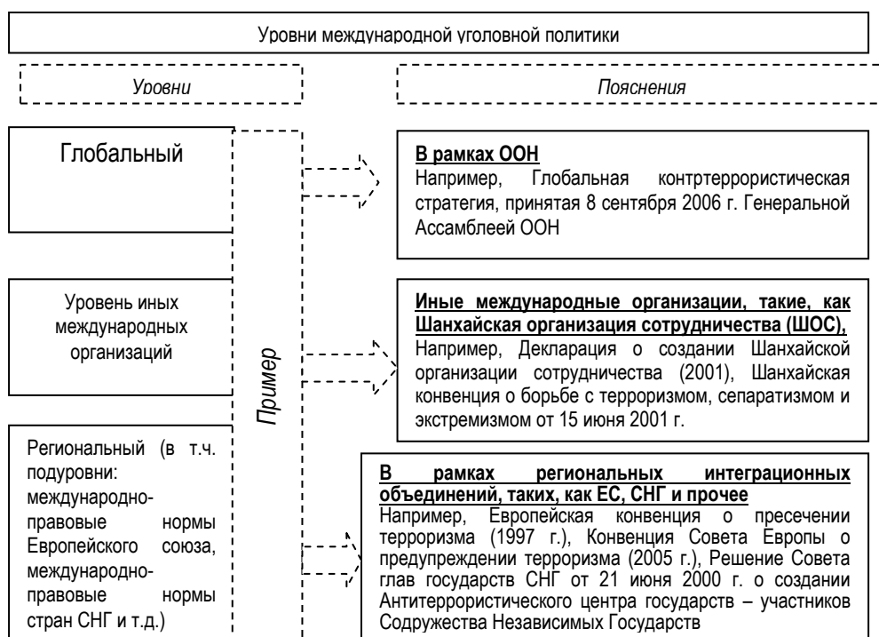
Рисунок 1 — Уровни международной уголовной политики Figure 1 — Levels of International Criminal Policy

Анализ международного сотрудничества в области борьбы с терроризмом. Ерохин Д.В. выделяет три основных уровня международной уголовной политики: глобальный, уровень иных международных организаций, региональный (рисунок 1) 1 .