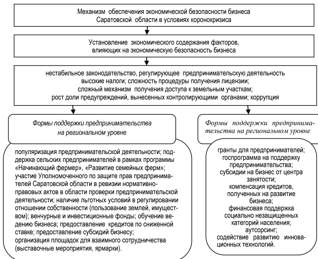
Рисунок 2 – Механизм обеспечения экономической безопасности бизнеса Саратовской области в условиях коронокризиса 1