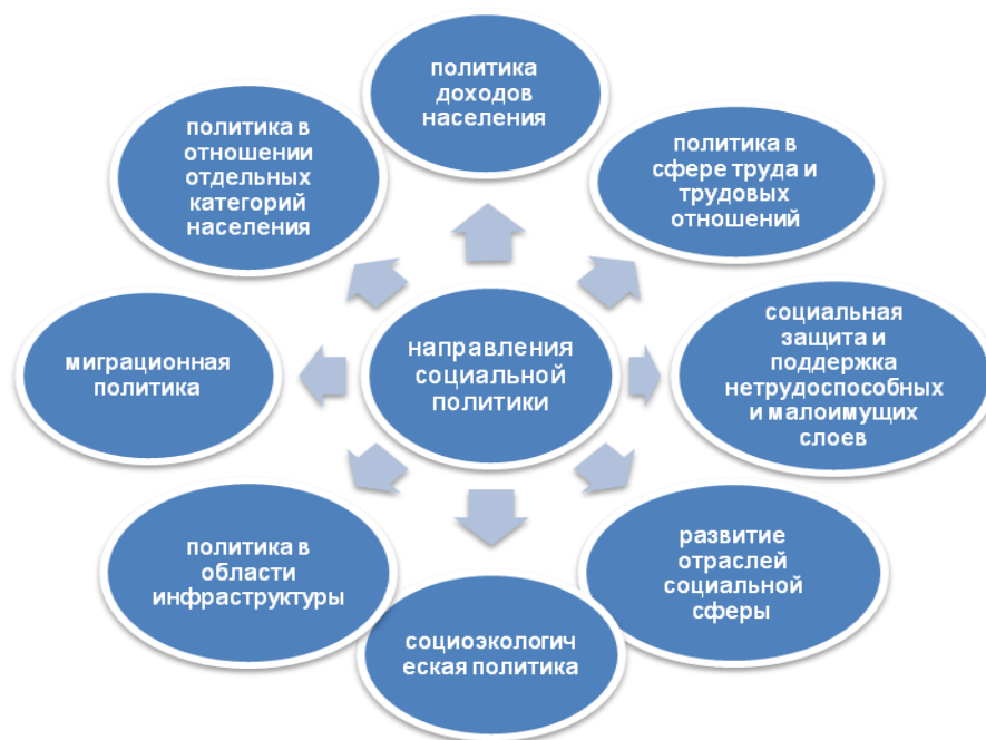
Рисунок 1 – Направления социальной политики РФ Figure 1 – Directions of social policy of the Russian Federation

В науке уже сложилось понимание социальной политики в качестве деятельности государственных институтов по управлению социальной сферой. Это один из важнейших видов государственной политики – обратимся к ее основным направлениям.