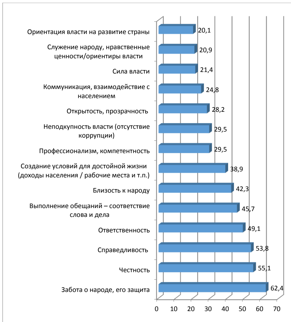
Рисунок 1 – Наиболее значимые характеристики, влияющие на формирование репутации власти, %

Целью следующего вопроса было выявить аспекты деятельности представителей государственной власти, которые являются наиболее важными. Респондентам было предложено выбрать из перечня вариантов пять, которые они посчитали наиболее значимыми (рис. 1).