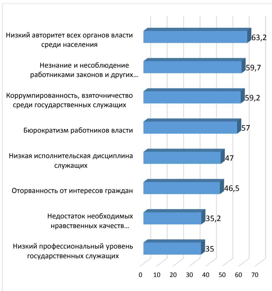
Рисунок 3 – Причины недоверия населения к власти, %

Вторым вопросом про доверие, заданным респондентам, был: «Какие причины недоверия населения к власти Вы можете отметить?» (рис. 3).