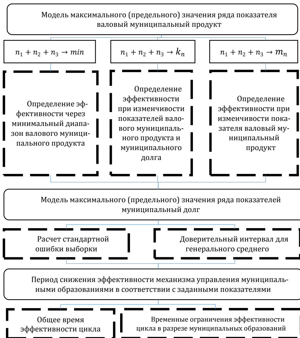
Рисунок 1 – Модель оценки эффективности механизма управления муниципальным образованием