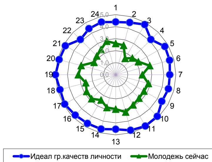
Рисунок 2 – Соотношение представлений молодых активистов об идеальном гражданине и молодежи сейчас