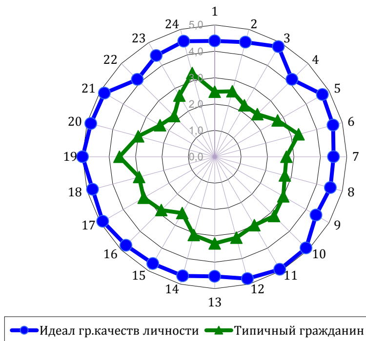
Рисунок 1 – Соотношение представлений молодежи об идеальном гражданине и типичном гражданине РФ