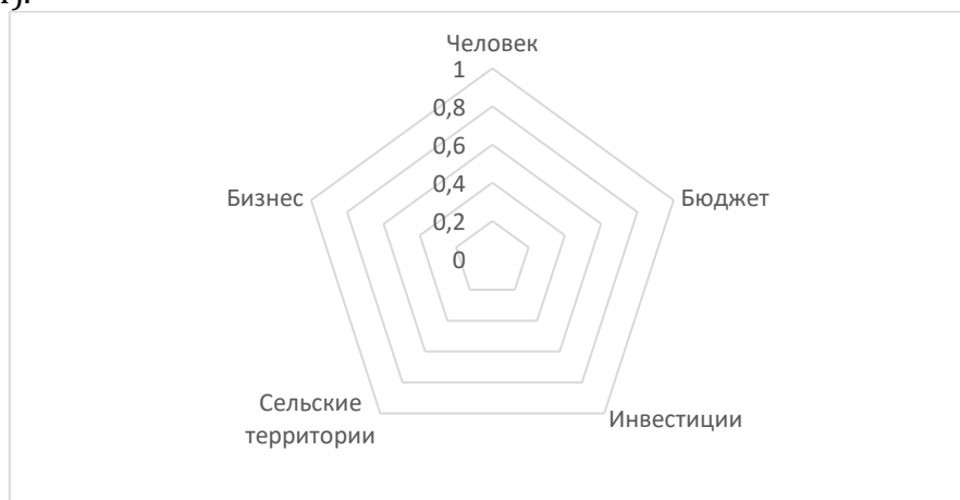
Рисунок 3 – Визуализация рисков трансформации сельских территорий на основе градации потерь

Наиболее интересным выступает критериальный блок, обусловленный повышением инвестиционной привлекательности сельских территорий с целью стратегического развития. Первоначальным инструментом, используемым для данного подхода, выступает прогнозирование рисков сельской трансформации. Система прогнозирования рисков сельской трансформации включает два этапа: визуализацию рисков трансформации сельских территорий на основе градации потерь (рис. 3); расчет показательной базы рисков трансформации сельских территорий на основе формирования инвестиционной привлекательности (рис. 4).