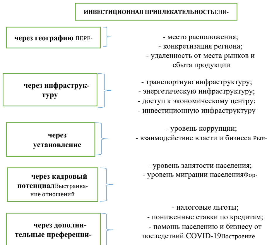
Рисунок 2 – Критерии отбора инвестиционной привлекательности сельских территорий

Изучая вопрос инвестиционной привлекательности сельских территорий, стоит уделить внимание критериям, позволяющим выделить характеристику условий, способствующих привлечению инвестиций (рис. 2).