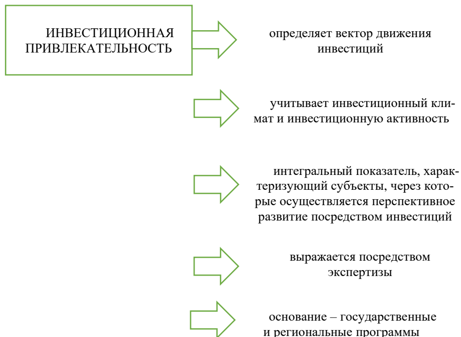
Рисунок 1 – Подходы к инвестиционной привлекательности Figure 1 - Approaches to investment attractiveness

Наибольшее общее представление инвестиционной привлекательности территории позволяет сформировать интегральный индикатор, включающей в себя: (1) потенциал конкурентоспособности территории, (2) потенциал возможности привлечения свободных инвестиционных ресурсов, (3) потенциал, отражающий инвестиционную ёмкость региона. В рамках данных потенциалов достаточно интересным показателем выступает инвестиционная ёмкость региона, которая продуцирует степень восприятия хозяйствующих субъектов к формируемым инвестициям. Выделенный потенциал является достаточно актуальным для сельских территорий. В данном случае создание инвестиционной привлекательности сельских территорий рассматривается с позиции получения эффекта от инвестиций для всех хозяйствующих субъектов. Инвестиционная ёмкость отражает эффект от инвестиций для населения и иных экономических агентов, находящихся на данной территории. Если эффект от инвестиций минимальный, а инвестиционная привлекательность территории явля-