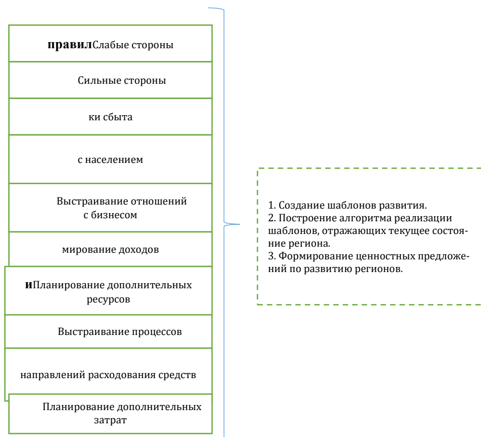
Рисунок 3 – Инновационная бизнес-модель шаблонов, адаптированная под устойчивое развитие региона

2. Выделение сильных сторон – формирование шаблонов-эффектов, позволяющих повысить значимость человеческих, природных, технологических и экономических потенциалов в разрезе устойчивого развития региона.