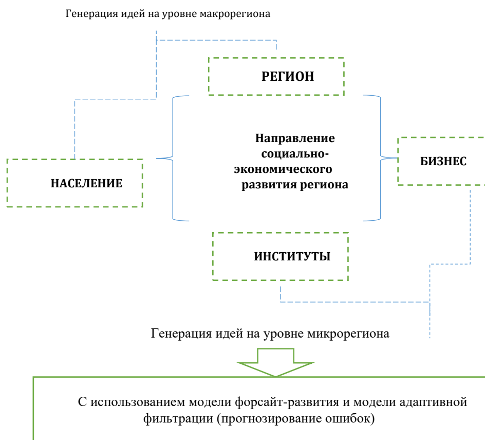
Рисунок 4 – Инновационная бизнес-модель генерации идей, адаптированная под устойчивое развитие региона

изменений и с учетом уровней предложения мероприятий по решению социально-экономических проблем. Так, генерация идей на макроуровне позволяет решить социально-экономические проблемы, приходящие на региональный уровень за счет взаимосвязи с федеральными направлениями развития территорий, пространственными стратегиями и концепциями, ролью НТП в модернизации отраслей.