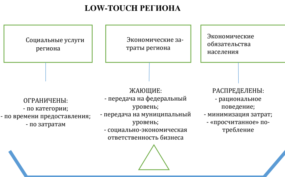
Рисунок 2 – Инновационная бизнес-модель весов Low-touch, адаптированная под устойчивое развитие региона