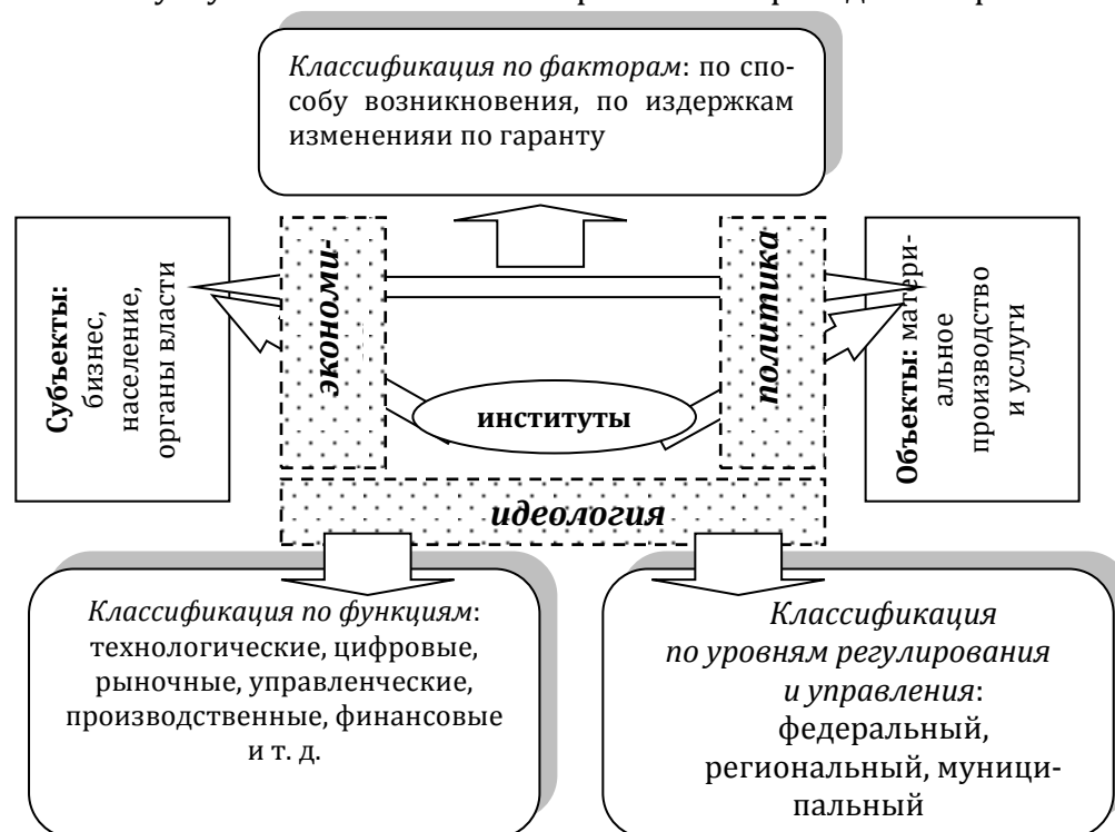
Рисунок 1 – Матрица внешней среды рынка образовательных услуг системы высшего образования

Авторское содержание матрицы внешней среды рынка образовательных услуг системы высшего образования приведено на рис. 1.