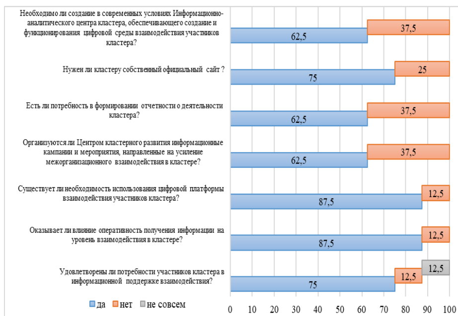
Рисунок 2 – Оценка системы коммуникаций в кластерах, % Figure 2 – Assessment of the communication system in clusters, %

На рисунке 2 отражены результаты анкетирования по вопросам взаимодействия участников кластеров.