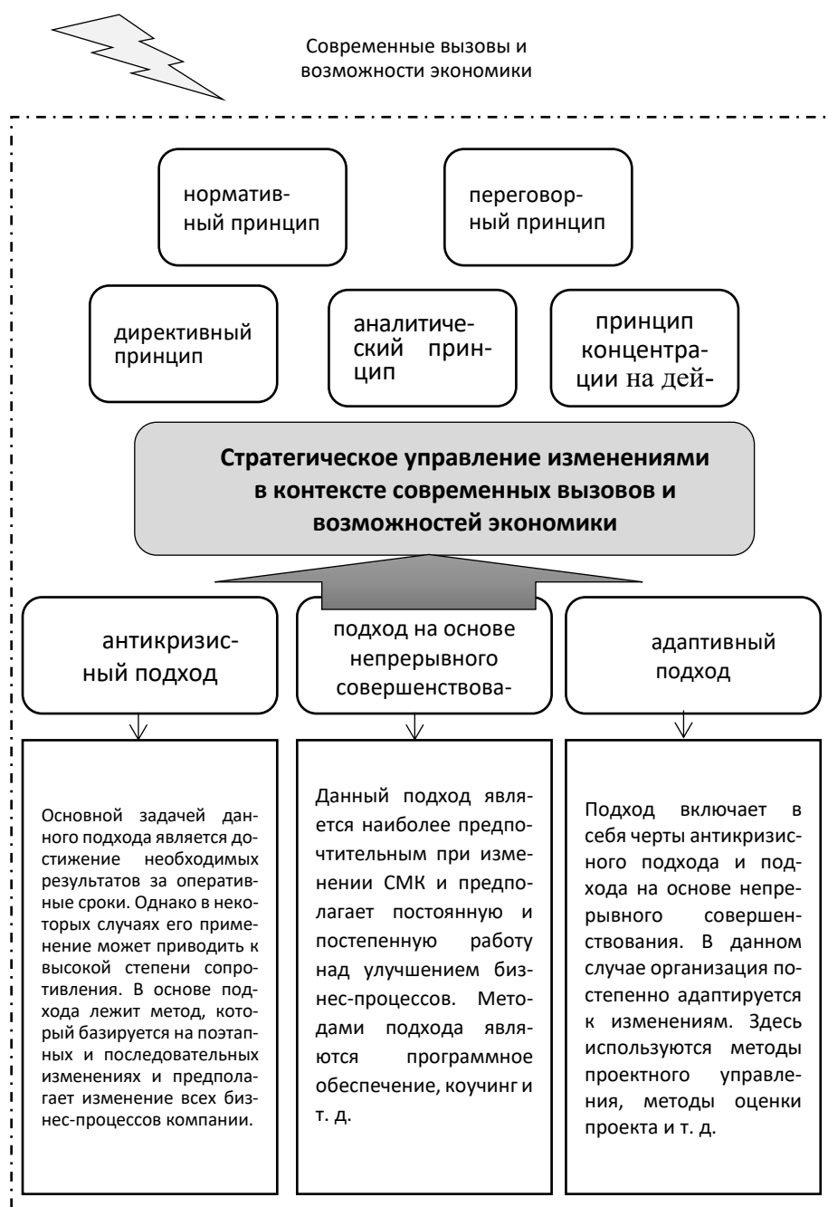
Рисунок 4 – Предлагаемая модель стратегического управления изменениями в условиях современных вызовов и возможностей экономики